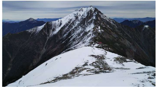
11月3日(日) 中白根山頂より