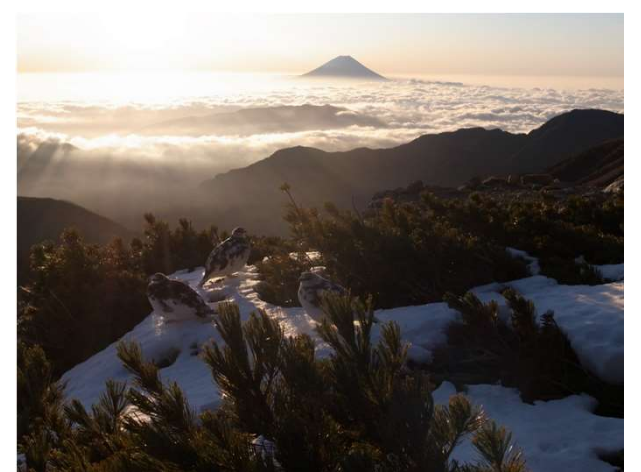
今年もご利用、ありがとうございました