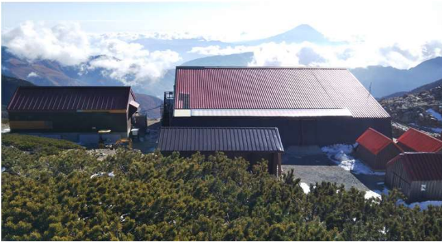
11月4日(月) あと数日で無人となります